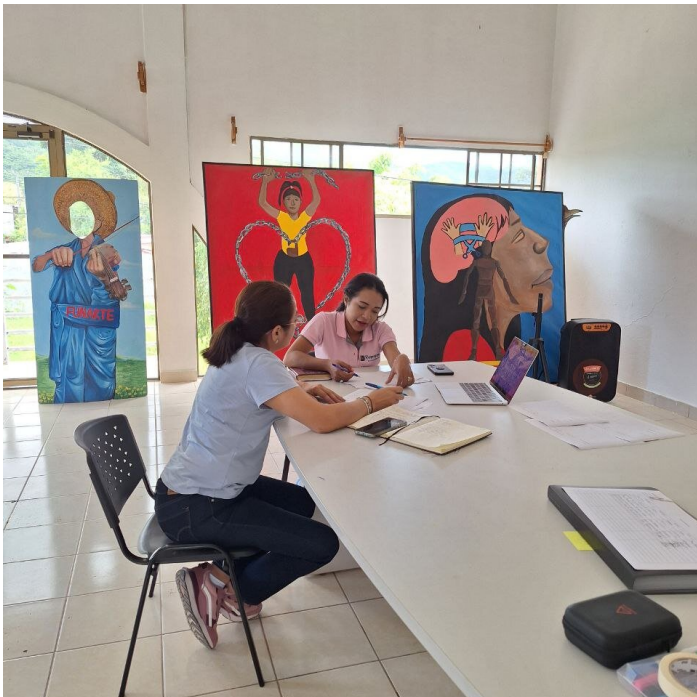
Estelí, 2024

Nel corso di questi mesi e dopo essermi spostata nell'ufficio di Funarte , ho potuto collaborare con diverse organizzazioni del cluster nel lavoro di sensibilizzazione delle famiglie contadine della zona Nord della costa Pacifica, affrontando temi come la violenza di genere, i ruoli di genere e la costruzione sociale delle identità. La maggior parte degli incontri è stata fatta con gruppi misti, comprendenti uomini e donne di ogni età. Si sono ottenuti degli scambi interessanti e si è creato uno spazio per le donne per poter portare la propria voce di fronte agli uomini della loro stessa comunità. Allo stesso tempo, si è portato avanti il lavoro di formazione e sensibilizzazione delle équipes tecniche e delle direzioni delle organizzazioni, fornendo loro strumenti per la trasversalizzazione delle questioni di genere e riflettendo su concetti quali l'identità di genere, l'orientamento sessuale, l'espressione di genere e le questioni di genere legate ai progetti di sicurezza alimentare.