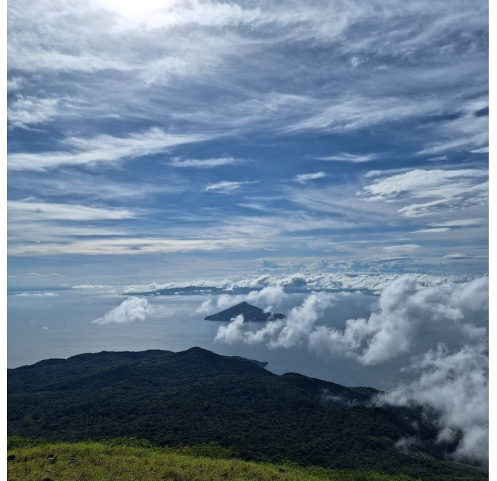
Momotombo, 2024

A gennaio e nei primi mesi del 2025 proseguirà il lavoro sulla strutturazione di linee strategiche e per l'organizzazione di un incontro cluster interamente dedicato alle questioni di genere nel corso dell'anno.