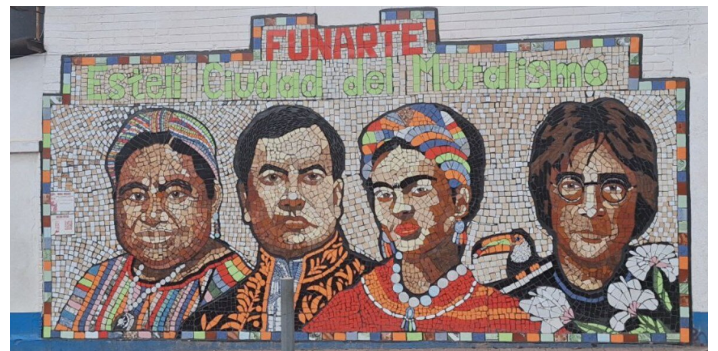
Estelí, 2024