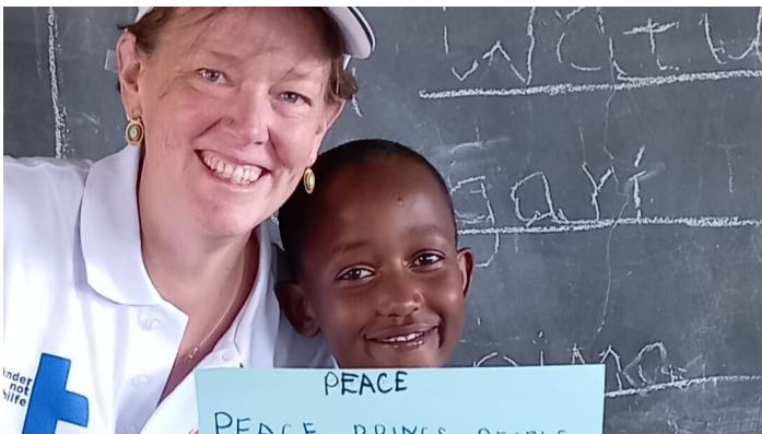
Ich mit einem Kind von einem der Friedensclubs