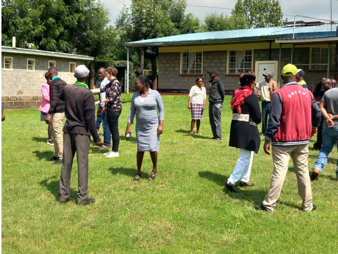
LehrerInnen beim interaktiven Lernen