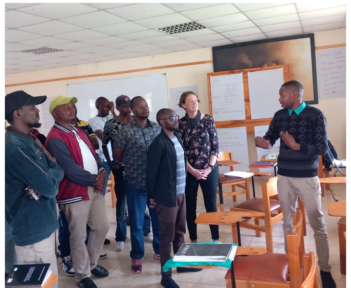
Training mit BerufsschullehrerInnen

Dieses Handbuch wird den Lehrpersonen nicht nur praxisnahe Methoden und Übungen an die Hand geben, sondern auch konkrete Beispielanwendungen bieten, die sofort im Unterricht umgesetzt werden können. Wir sind überzeugt, dass die Implementierung dieses Handbuchs dazu beitragen wird, die Soft Skills der BerufsschülerInnen nachhaltig zu stärken und sie somit besser auf den Eintritt in die Arbeitswelt vorzubereiten.