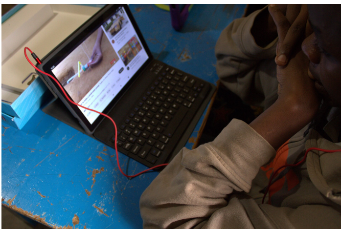
Ein Jugendlicher beim Lernen mit einem Tablet

Jetzt ist das Schuljahr vorbei. Zu Beginn des neuen Schuljahres möchte ich die CBC-Champions treffen um zu sehen, ob es Fortschritte bei der Umsetzung gibt.