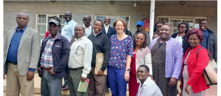
Eine Gruppe von SchulleiterInnen

Das vorherige Curriculum legte den Fokus auf das Auswendiglernen von Definitionen und Theorien, und jene Schulkinder, die am besten darin waren, erhielten die besten Noten.