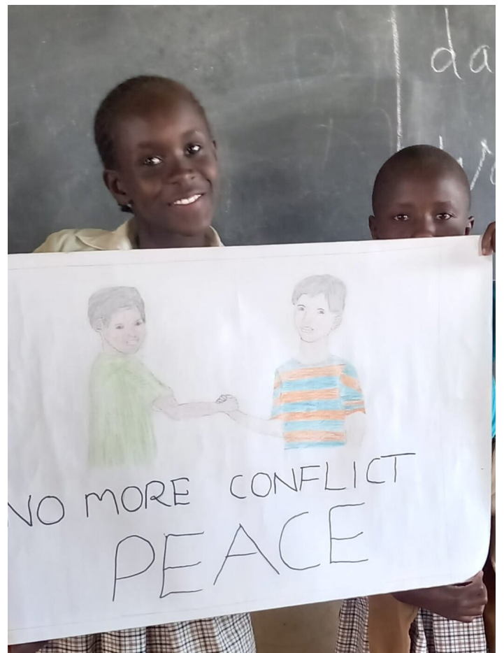
Zwei Kinder mit ihrem Bild