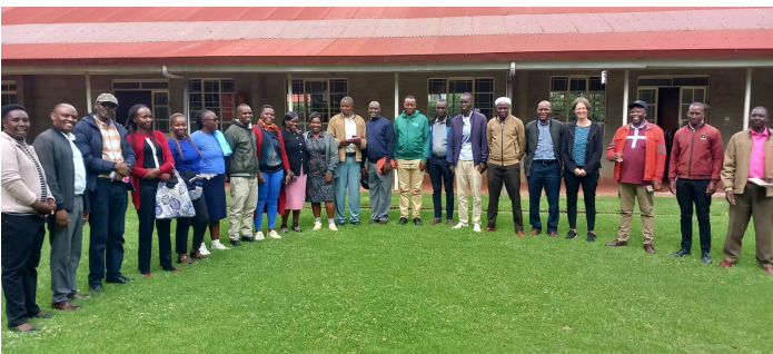
CBC Champions aus Schulen von zwei Bezirken