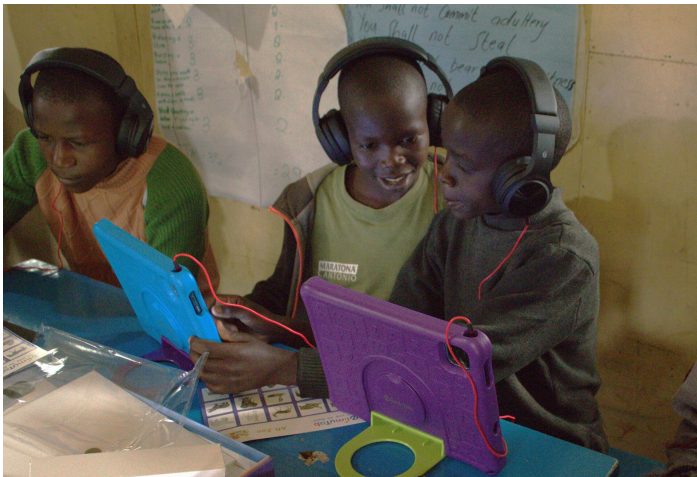
Kinder beim interaktiven Lernen

verbessern und den Kindern die notwendigen Kompetenzen für die digitale Zukunft zu vermitteln.