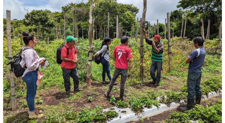
Visite d'une plantation de physalis

Je vous fournirai des détails approfondis sur les projets et leurs résultats dans ma prochaine lettre !