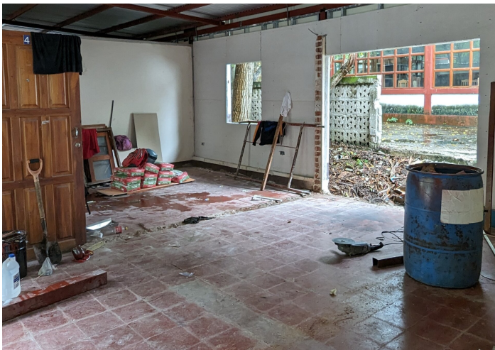
Construction de l'Ecotienda

Im nächsten Schreiben folgen ausführliche Informationen zu den Projekten und ihren Ergebnissen!