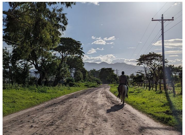
Sur le chemin du bureau

Hoffen wir, dass die Ernte in einem Land, dessen Wirtschaft hauptsächlich von der Landwirtschaft abhängt, nicht so katastrophal ausfallen wird wie befürchtet und dass die bevorstehende Trockenzeit milder sein wird.