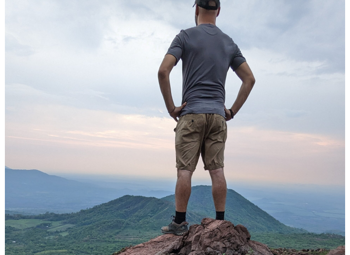
Excursion vers le volcan Telica

J'espère que vous avez passé de bonnes vacances d'été en Suisse et que la rentrée s'est bien passée. Je vous souhaite déjà de très belles fêtes de fin d'année. Prenez soin de vous et à bientôt !