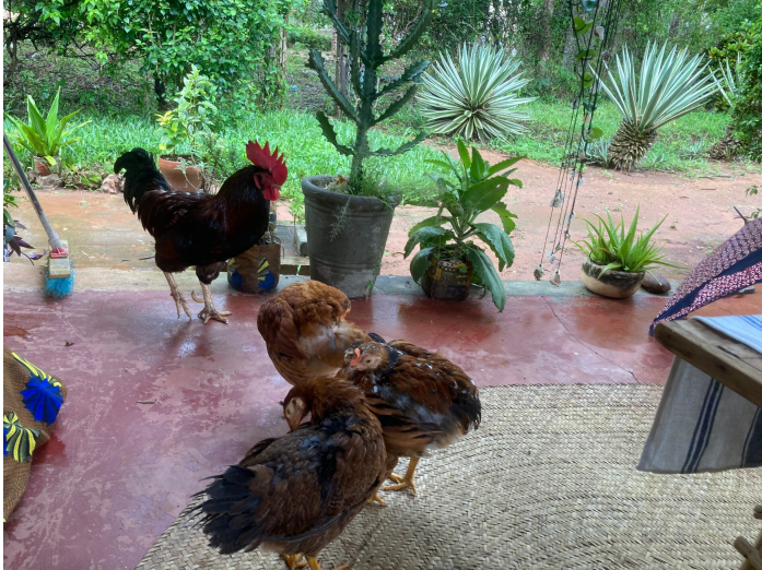
Neue Hühner, alter Gügge!