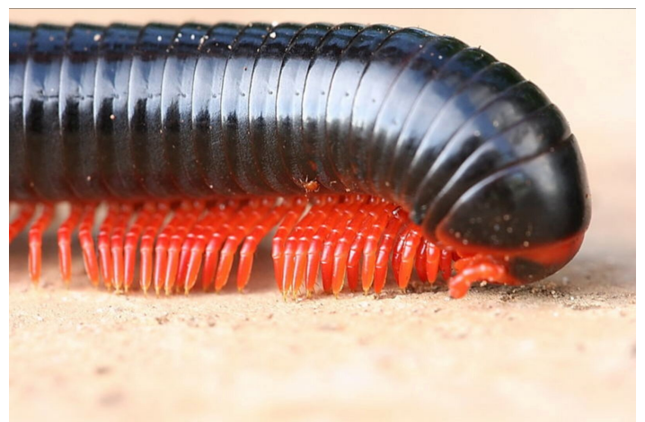
Giga in Bewegung

Sie werden bis zu 32 cm lang und werden deshalb auch Gigas genannt und leben etwa 8-10 Jahre.