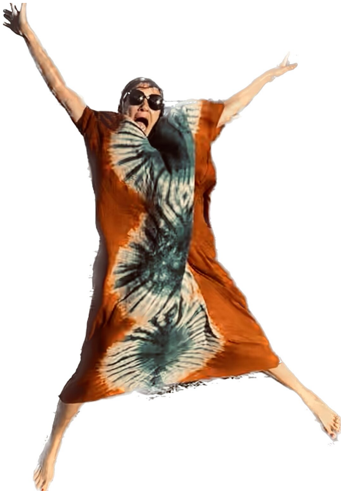
6 | www.comundo.org Deeras meine Lieblingskleidung