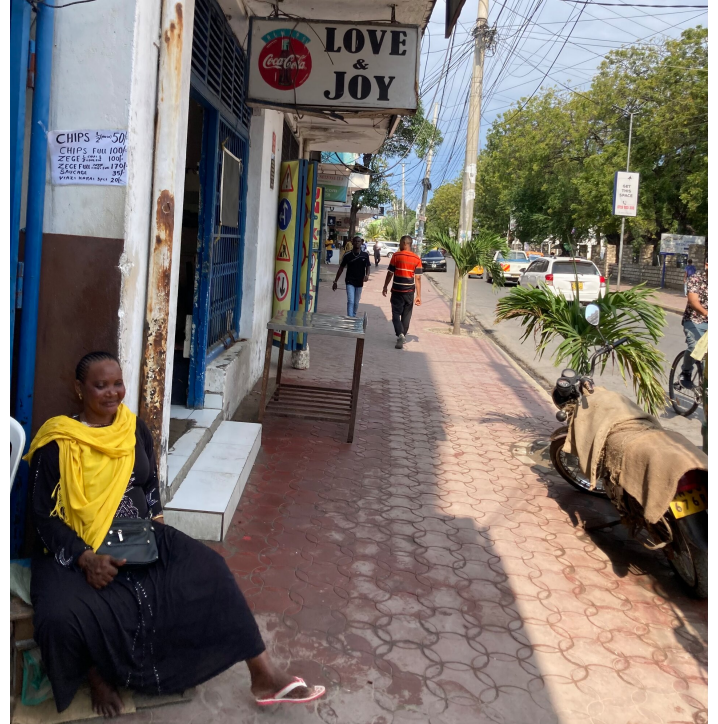
Love and Joy in Mombasa