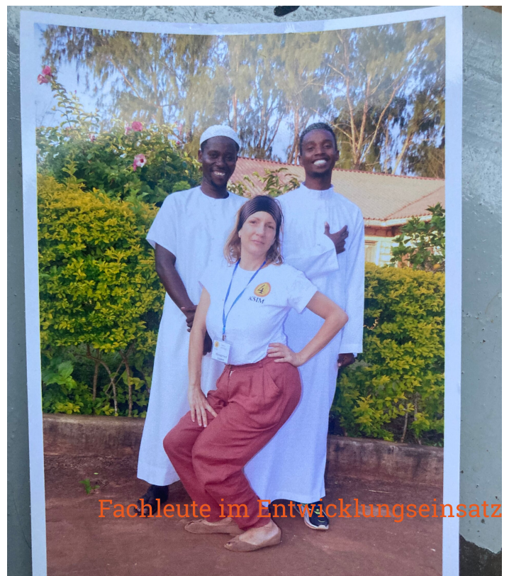
Fachleute im Entwicklungseinsatz