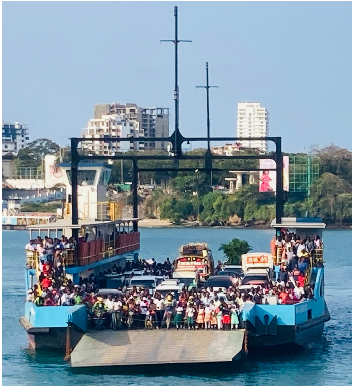
Fähre nach Mombasa – ein Nadelöhr