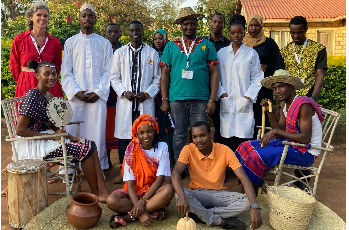
Theater am Tag der offenen Tür bei KSIM

Es war schön für mich, viele von Euch während meiner Sensibilisierungsreise persönlich zu treffen und mich mit Euch über meinen Einsatz bei Comundo in Kenya auszutauschen, interessante Fachgespräche zu führen, und auch Persönliches voneinander zu erfahren. Ich bin seit Mitte November wieder in Kwale zurück an der Kenya School for Integrated Medicine. Für mich war es eine Reise aus dem Winteranfang in den Sommeranfang und von einer Welt in eine andere. Mein Leben spielt sich zwischen zwei sehr verschiedenen Welten ab. Dies ist anregend, spannend, doch auch anstrengend, und es kann müde machen. Ich habe aufgrund dessen, die letzten Tage viel geschlafen.