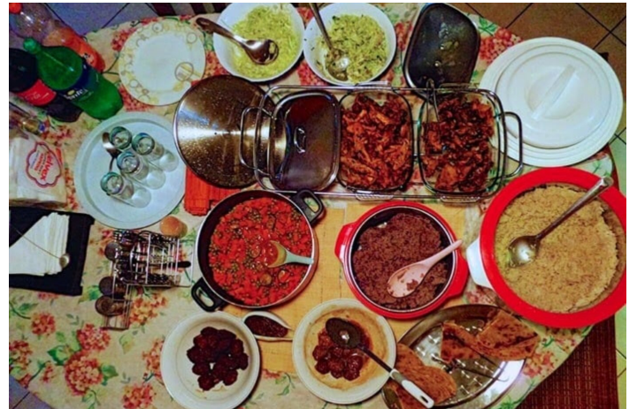
Weihnachtsessen in Kenia

Das typische Weihnachtsessen ist Fleischartopf mit Kartoffeln und Gemüse, dazu gibt es Chapati oder Maiskuchen sowie Ziegen- oder Rindfleisch vom Grill.