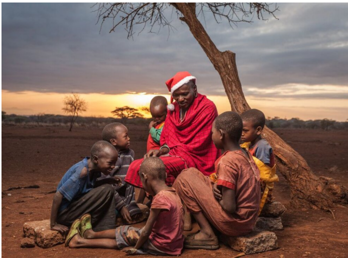
Masai als Santa