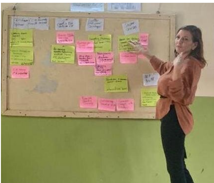
Kapazitätsbildung an einer Schulung

Wenn ähnliche Herausforderungen bei mehreren Teilnehmenden sichtbar werden, veranstalten wir meistens ein gemeinsames follow-up Training. Diese Erkenntnisse werden auch in die kommenden Schulungen eingebracht.