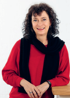
Caroline Morel Presidente di Comundo

Il 2022 è stato ancora un anno di crisi: mentre si sentivano ancora gli effetti della pandemia di Coronavirus, la guerra in Ucraina ci ha colto di sorpresa. Allo stesso tempo, il cambiamento climatico non si arresta. Siccità, inondazioni o tempeste colpiscono diverse regioni del mondo e i Paesi più poveri ne soffrono particolarmente. Siamo quindi ancora più soddisfatti di aver avuto nel 2022 un totale di 94 cooperanti che hanno contribuito alla nostra visione di un mondo più giusto insieme a 105 organizzazioni partner. L'interscambio di esperienze con le e i cooperanti è molto apprezzato dalle organizzazioni partner e una valutazione esterna in Perù e Colombia certifica che Comundo sta svolgendo un lavoro ben organizzato ed efficace (vedi intervista a Regula Bähler a pagina 6).