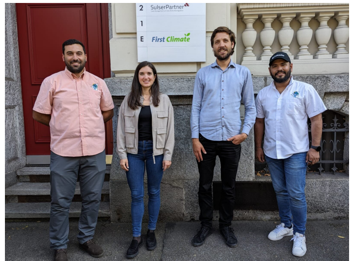
Foto di rito dopo la riunione a Zurigo

Il 27 settembre, seconda giornata nella città di Zurigo. Sì, perché il giorno prima avevamo fatto visita ad Agroscope, un organismo che è parte dell'Ufficio Federale dell'Agricoltura. Se nella mattinata del 27 abbiamo fatto visita a MyClimate, cliente di lunga data di APRODEIN nell'acquisizione di crediti di carbonio, il pomeriggio è toccato a First Climate, azienda che fornisce soluzioni per la protezione del clima e delle energie rinnovabili. Sin da subito c'è stato un forte interesse da parte degli interlocutori sul biochar (carbone vegetale), sul potenziale produttivo e sui benefici di certificare crediti di carbonio derivanti dal biochar. Loro hanno dato disponibilità ad approfondire un possibile finanziamento per ampliare la capacità produttiva di APRODEIN a cambio di un accordo di esclusività.