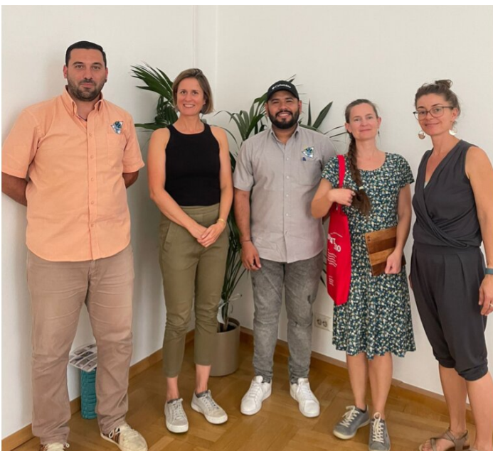
Foto di rito dopo la riunione a Vienna