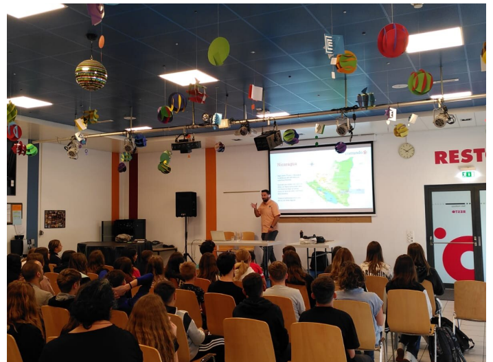
Foto dell'attività con le allieve e gli allievi di Gravesano

Per maggiori informazioni sulla visita a Gravesano, potete visitare il seguente indirizzo internet https://www.comundo.org/it/blog/cos-e-il-nicarabua-11176