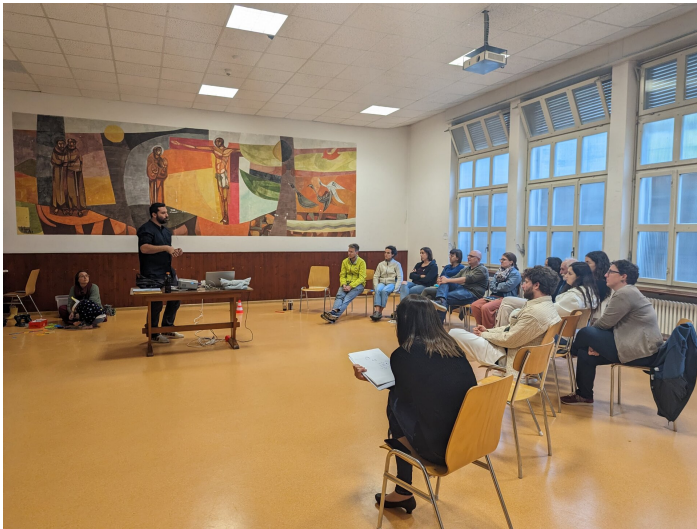
Foto durante la presentazione a Faido

cooperante sul terreno. Successivamente, abbiamo condiviso il nostro esempio pratico su ciò che vuol dire collaborare tra due culture, visioni e vissuti così diversi ma ormai intrecciati.