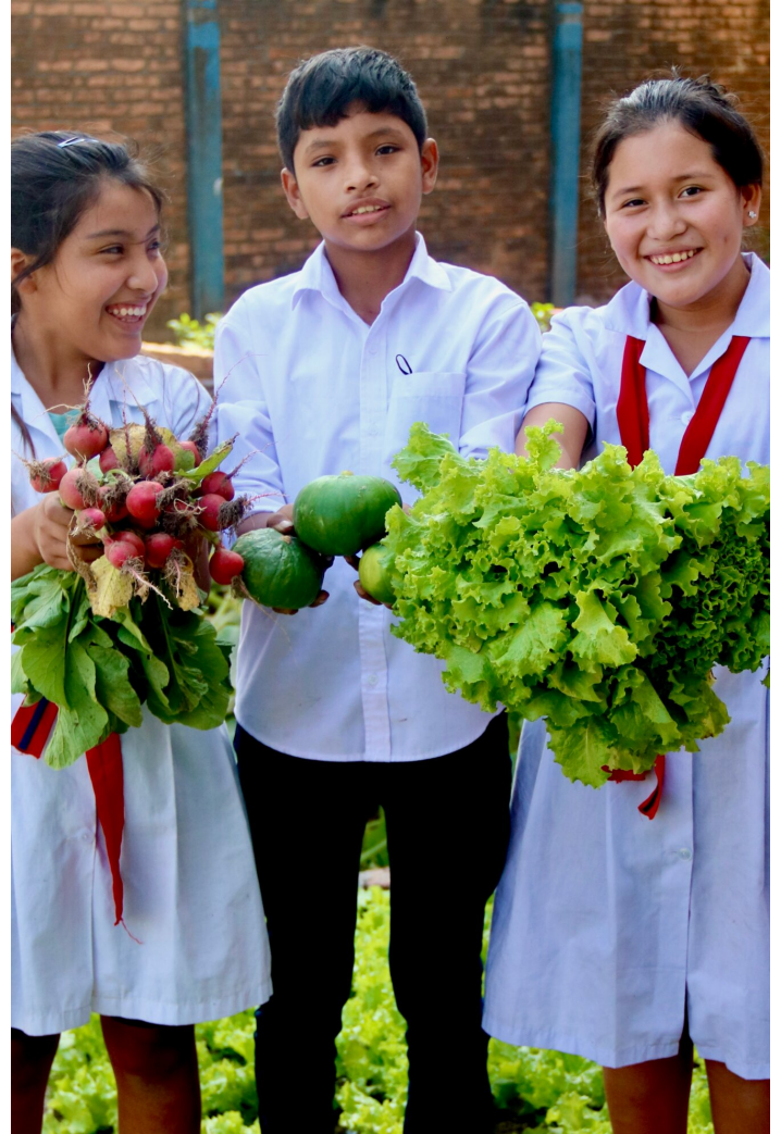
Le GTCCJ soutien des projets de potagers scolaires.