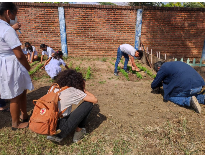
Tournage d'une vidéo sur les potagers.

Je suis également amenée à produire du matériel d'information qui peut être diffusé sous forme numérique ou via des chaînes de radio et de télévision.