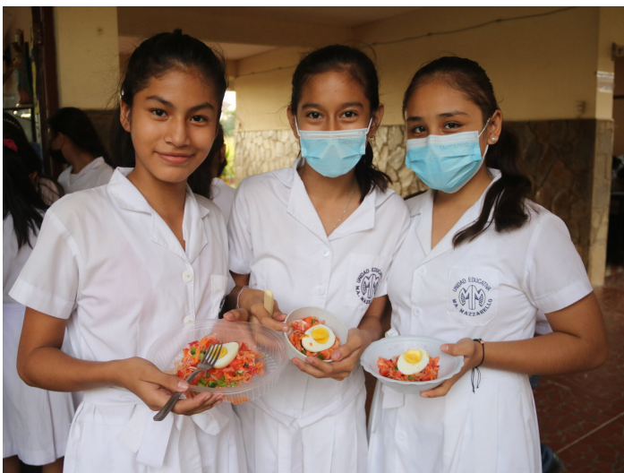
Les élèves sont sensibilisé·e·s à manger sainement.

Son objectif est de promouvoir et de coordonner des actions afin d'activer des processus de transition pour faire face à la crise climatique et ce, dans une perspective de justice.