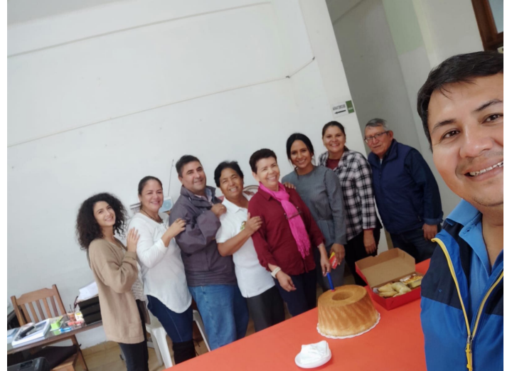
L'équipe de l'INCADE m'a accueillie dans ses bureaux.