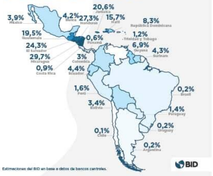
Le rimesse in proporzione al PIL dei paesi LATAM