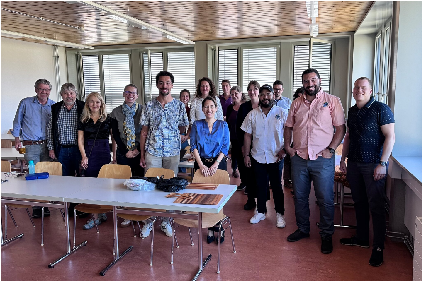
Foto di rito dopo la presentazione di APRODEIN alla facoltà di agricoltura dell'università professionale di Berna