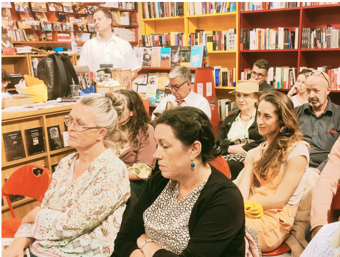
Conférence avec Justapaz à la Librairie Albatros, Genève.

Après mon congé maternité, en septembre, je me suis rendue en Suisse avec mon fils de 7 mois afin de réaliser des ateliers de sensibilisation portant sur mon travail pour la défense des droits humains avec Justapaz.