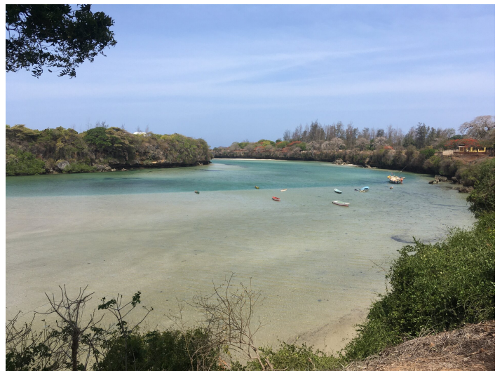
Aussicht von der Schule

Ein erster Eindruck von der Umgebung und der Schule konnten wir in diesem Februar bei unserem Besuch vor Ort sammeln, und dadurch wird nicht alles total neu sein. Die Kinder haben die Schule selbst mitausgewählt. Es ist eine kleine internationale Schule mitten in der Natur, direkt am Creek umgeben von Mangroven.