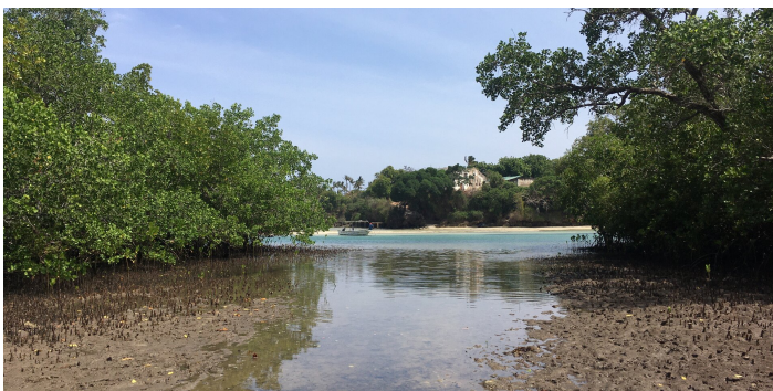
Mangroven am Takaungu creek