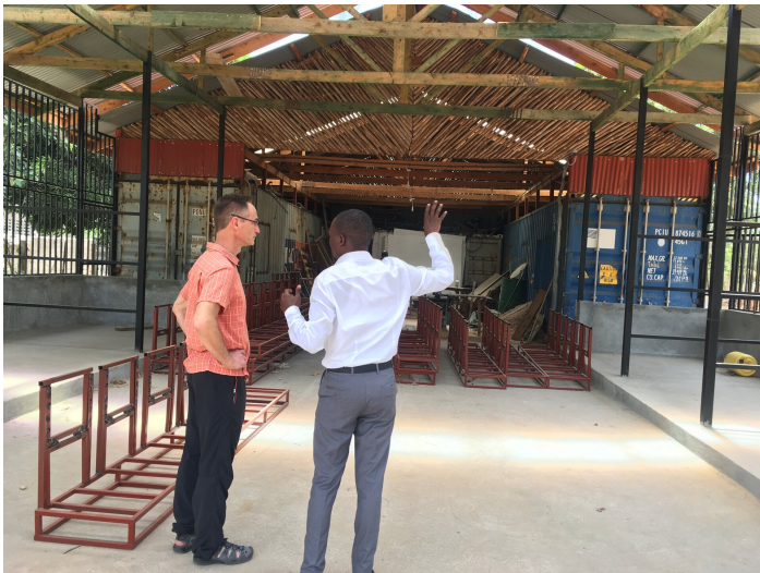
Neue Werkstätten entstehen

Derzeit wird am College ein neuer Studiengang für Medizinaltechnik (BME) und die Einrichtung von Werkstätten für die Reparatur von Geräten eingeführt. Das NCMTC arbeitet seit mehreren Jahren als Partnerorganisation mit Comundo zusammen.