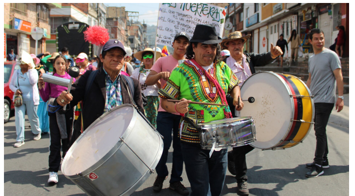
Une manifestation menée tambours battants.