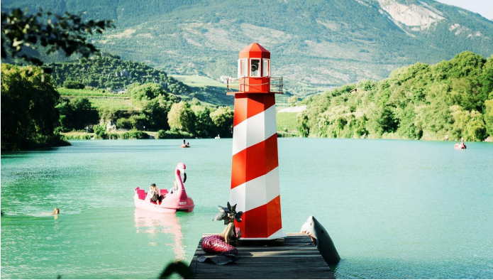
Rendez-vous à Géronde en juin, ce petit paradis sur terre.