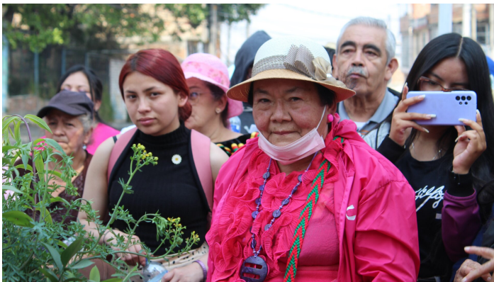
Certains regards valent bien plus que mille mots.