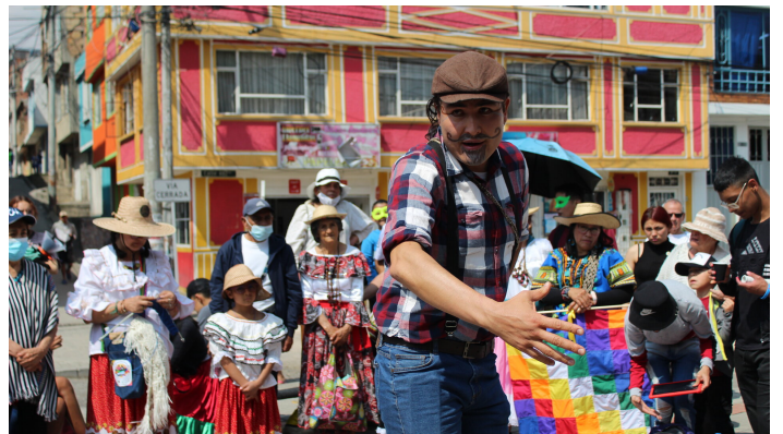
Rien de tel que du théâtre pour sensibiliser la population.