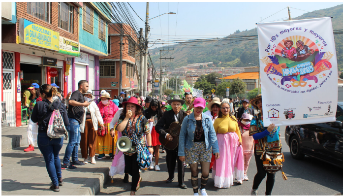
La communauté fait entendre sa voix dans le quartier.

La traditionnelle Minga de Carnaval a repris ses droits fin février comme c'était le cas avant la pandémie. Cette année, les aîné-e-s du monde entier étaient à l'honneur.