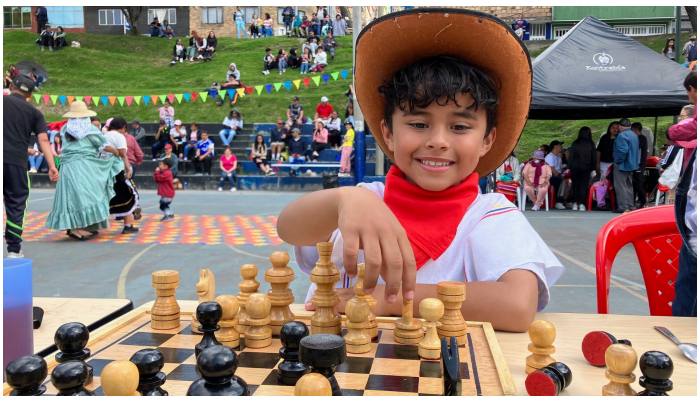
La jeunesse, elle aussi, était de la partie... d'échecs.