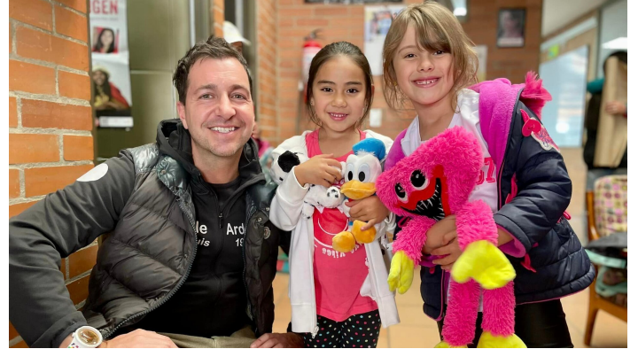
Le directeur d'Ardévaz, ici, avec des jeunes de Casitas.