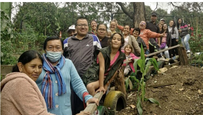
La belle équipe des jardins communautaires au complet.

Autre annonce de taille : la Fondation du festival soutient à nouveau Casitas Bíblicas avec, cette fois-ci, un généreux don pour les jardins communautaires. De quoi améliorer nos infrastructures mais surtout motiver le travail assidu d'une communauté entière. Merci !