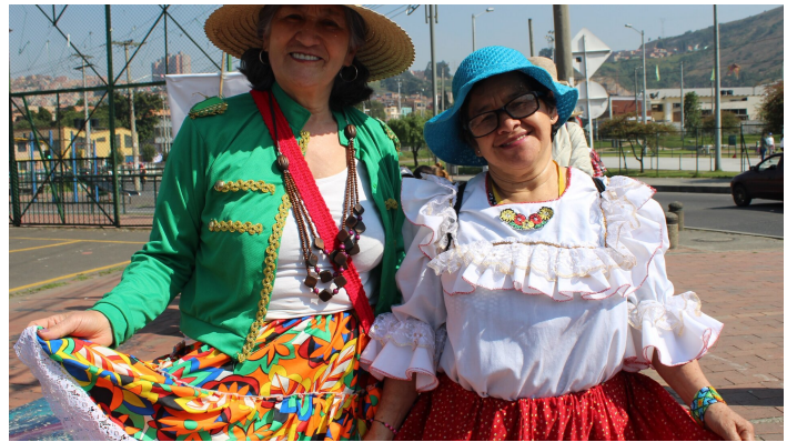
Des sourires, de la joie et le tout en costume traditionnel.