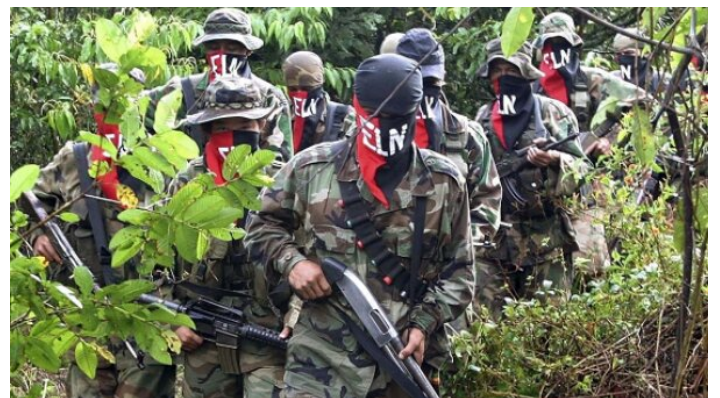
L'ELN : la plus grande guérilla du pays à ce jour.

Par ailleurs, le président compte entamer des discussions avec les narcotrafiquants pour qu'ils se soumettent aussi à la justice et participent à ce grand processus qui tendrait enfin vers la « paix totale ». Pas besoin de vous faire un dessin pour comprendre que le défi est simplement titanesque. Surtout quand on sait que les mandats présidentiels en Colombie ne durent pas plus de quatre années. C'est court !