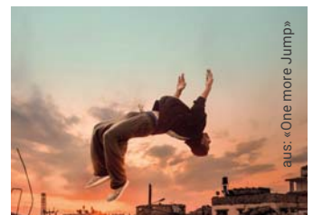
aus: «One more Jump»

Comundo zeigt vom 4. bis 9. Dezember im stattkino Luzern Spiel- und Dokumentarfilme zu Menschenrechten für Schulen sowie für ein breites Publikum.