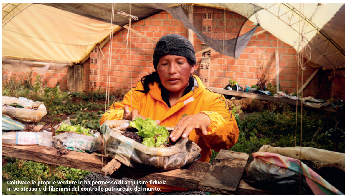
Coltivare le proprie verdure le ha permesso di acquisire fiducia in se stessa e di liberarsi dal controllo patriarcale del marito.

Per il nostro cooperante Jérôme Gyger, che da quasi due anni sostiene il progetto dell'organizzazione per l'empowerment delle donne attraverso l'agricoltura ur-